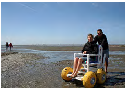
Links: Geländer mit Braille-Schrift Oben: Wattrollstuhl im festen Sandwatt